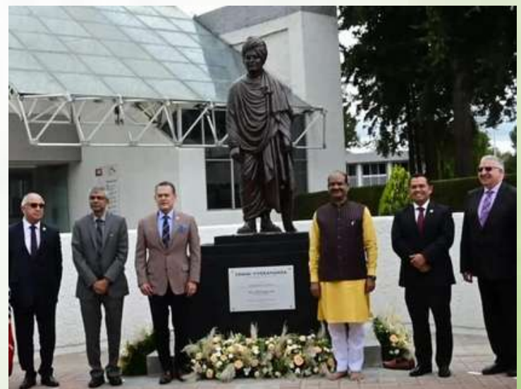
El H. Portavoz del Lok Sabha, S.E. Shri. Om Birla inauguró una estatua de Swami Vivekananda en la Universidad Autónoma del Estado de Hidalgo en México.

Esta es la primera estatua de Swami Vivekanand en toda América Latina. Será una fuente de inspiración para la gente, especialmente para los jóvenes de la región, para esforzarse y traer el cambio que llevará a su país a una nueva etapa. (02 de septiembre de 2022)