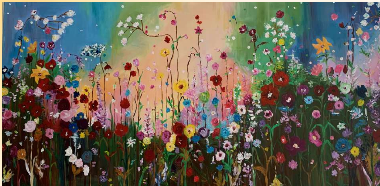
Por: Seema Agrawal (2021) Titulo: Primavera