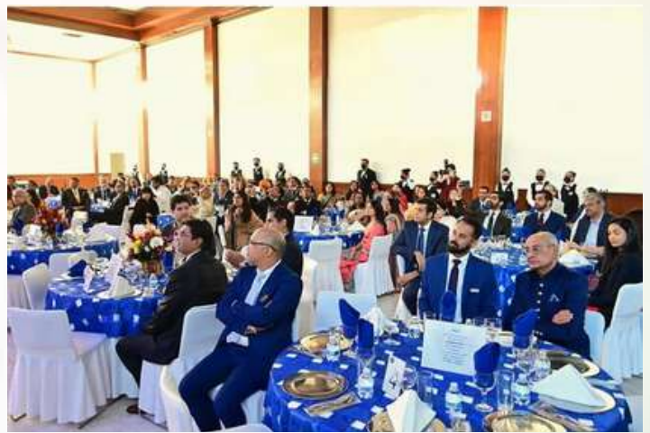
El H. Portavoz del Lok Sabha, S.E. Shri. Om Birla interactuó con la diáspora india en México. (01 de septiembre de 2022)

La comunidad es diversa y comprende empresarios, académicos y científicos, entre otros. Ellos están jugando un papel clave en el crecimiento y la prosperidad de México. El H. Portavos agradeció su entusiasmo por contribuir al progreso de la India y les deseó éxito.